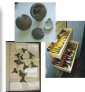
Ejemplares de las colecciones de Paleontología, Botánica y Zoología.