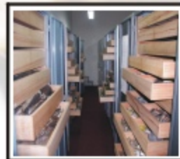
Conservación (Colecciones Generales)