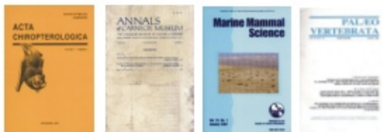
Portadas de algunas de las revistas que conforman nuestra Hemeroteca recibidas en 2008.

Desde el año 2000 se publican en nuestra página web una serie de artículos denominados "Documentos de Divulgación", los cuales contienen información acerca de las distintas temáticas desarrolladas en la institución (Antropología, Botánica, Paleontología y Zoología).