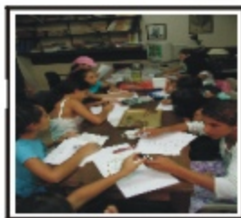
Divulgación (Actividades Educativas)