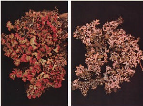
Cladonia ahtii y Cladonia salmonea

Ambas especies, conocidas del Departamento de Rocha, están constituidas por escamas o hojuelas de un vistoso color rojo en la primera de dichas especies que forma llamativas manchas de dicho color en el tronco de las palmeras.